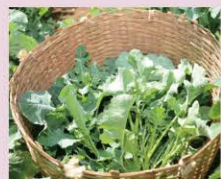
のらぼう菜 Norabo Greens 野良坊菜 野良坊菜 노라보우 나물

江戸時代にあきる野・五日市周辺で栽培が広まり、天明・天保の飢饉の際に、この菜花のお陰でこの地域が救われたといわれています。今では春の訪れを告げる特産の地野菜として知られています。2～4月に収穫期をむかえ五日市ファーマーズセンターなどで販売しています。