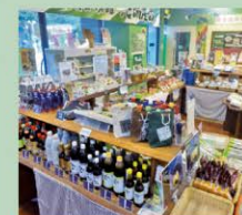
いろどり屋 あきる野市秋川1-8 ☎ 042-550-4552