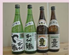
日本酒 Sake 日本酒 日本酒 일본술

あきる野産のものは甘みが強く、粒が大きいのが特徴です。種類も豊富で、採れたての食べ比べもおすすめ。6～7月に収穫期をむかえ、ファーマーズセンターなどで販売しています。