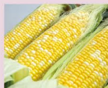
とうもろこし Corn 玉米 玉米 옥수수

秋川は鮎釣りでも有名な川です。6月の解禁を過ぎると新鮮な鮎を手に入れることができます。地酒や醤油もありますので、秋川でのバーベキューでは地元の食材をご賞味ください。