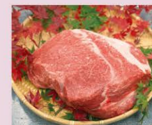
秋川牛 Akigawagyu Beef 秋川牛 秋川牛 아키가와 소고기

江戸時代初期のあきる野市乙津地区で生産され始めた軍道紙は、素朴で丈夫な紙として庶民生活に広く使われていました。現在、あきる野ふるさと工房では軍道紙の紙すき体験ができます。(→P2)