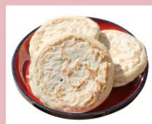
おやき Oyaki 豆沙煎餅 豆沙煎餅 오야키

水に恵まれたあきる野市には、古くから創業する2軒の造り酒屋があります。仕込み水には、秋川渓谷の山々に磨かれた湧き水を使い、じっくり醸造された地酒は、地元以外では手に入りにくいので、是非お土産にどうぞ。 野崎酒造、中村酒造 (→P15,16)