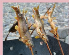
鮎 Ayu 香魚 香魚 은어

秋川牛は松阪牛や米沢牛と同じ元牛である黒毛和牛を、あきる野市内の牧場にて丹念に育てた東京都産の高級和牛です。ぜひご賞味ください。