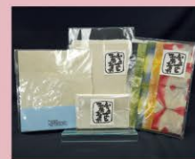
軍道紙(ぐんどうがみ) Gundo Paper 軍道紙 軍道紙 군도가미

五日市街道沿いには100年余続く、都内でも希少な醤油醸造元があり、昔ながらの味わいを持つ無添加醤油を造り続けています。 近藤醸造 株式会社 (→P15,16)