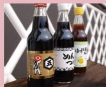
醤油 Soy Sauce 醤油 醤油 간장

江戸時代にあきる野・五日市周辺で栽培が広まり、天明・天保の飢饉の際に、この菜花のお陰でこの地域が救われたといわれています。今では春の訪れを告げる特産の地野菜として知られています。2～4月に収穫期をむかえ五日市ファーマーズセンターなどで販売しています。